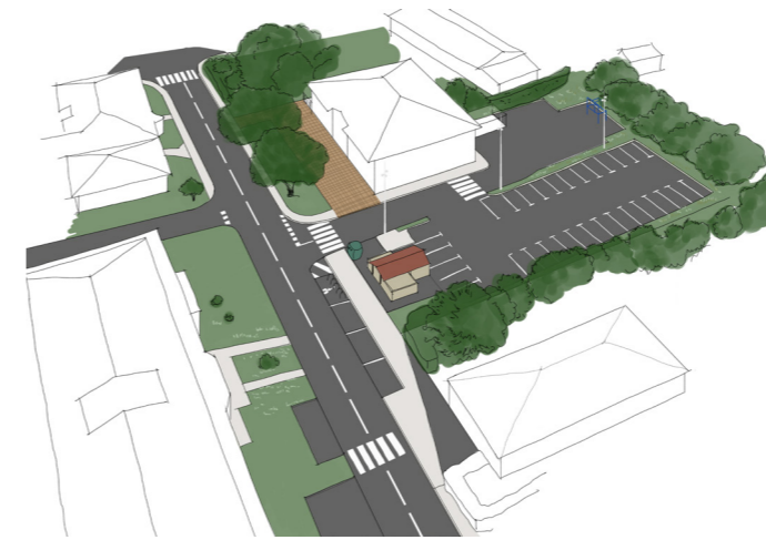
Axonométrie de l'existant