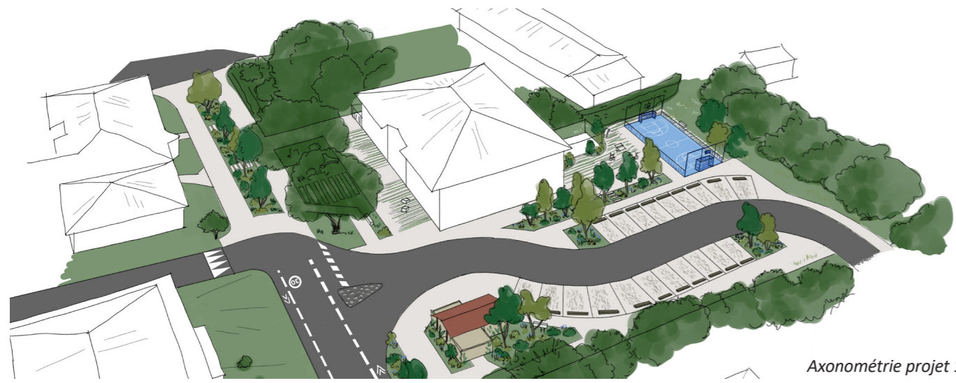
Axonométrie projet 1