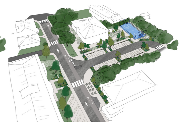
Axonométrie projet 2 variante